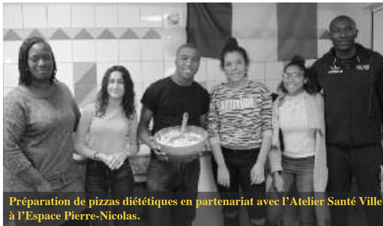
Préparation de pizzas diététiques en partenariat avec l'Atelier Santé Ville à l'Espace Pierre-Nicolas.