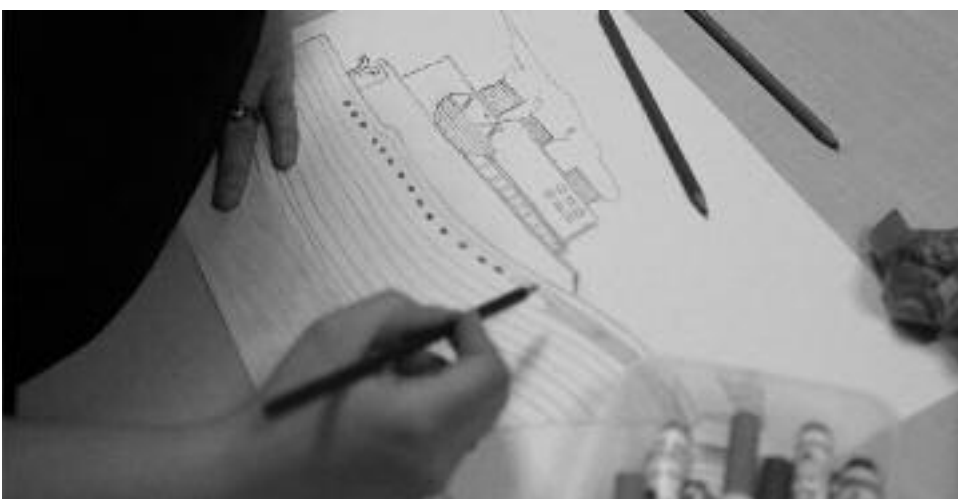
Le 8 novembre, lors du nouvel atelier du mercredi du centre social, certains habi-

Vous avez aussi la possibilité de faire d'autres dessins représentant les activités du centre social afin de participer à la création d'une œuvre collective. Si vous n'avez pas le matériel pour dessiner ou si vous avez besoin d'aide, rendez-vous au centre social.