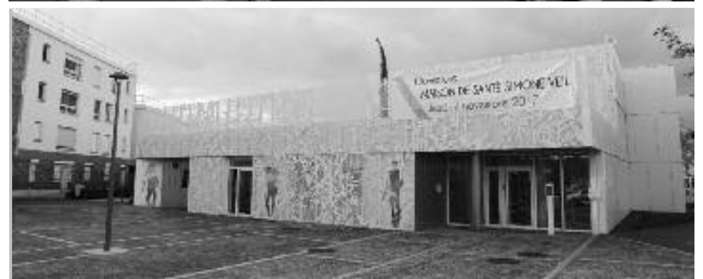
L'ancien Espace Brel-Brassens, bien connu des habitants, a laissé place à une maison de santé flambant neuve, exemplaire en matière de transition énergétique.