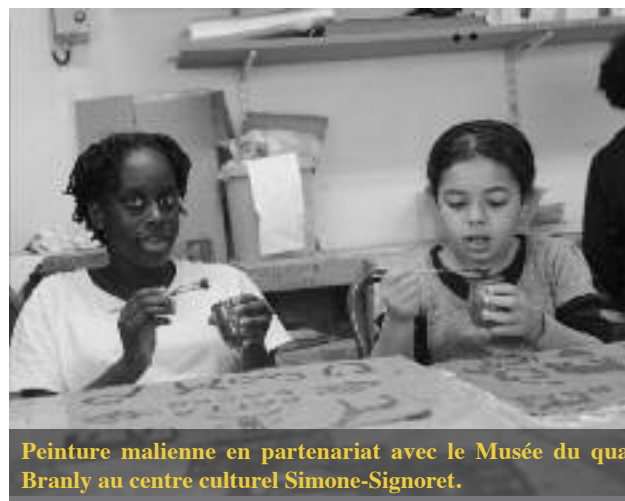
Peinture malienne en partenariat avec le Musée du quai Branly au centre culturel Simone-Signoret.