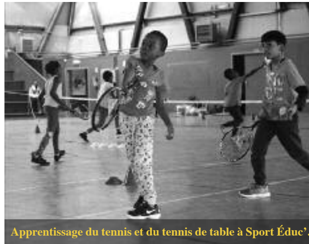
Apprentissage du tennis et du tennis de table à Sport Educ'.