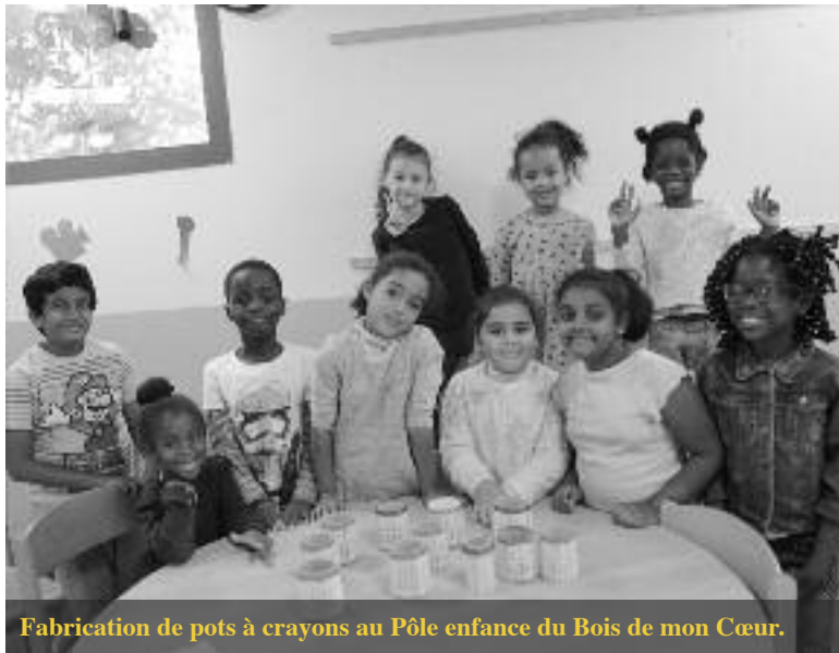
Fabrication de pots à crayons au Pôle enfance du Bois de mon Cœur.