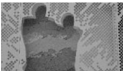
Les œuvres de Michel Poix ont été conservées et s'intègrent parfaitement à l'architecture de la nouvelle maison de santé Simone-Veil.