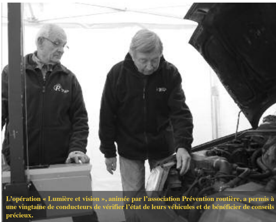
L'opération « Lumière et vision », animée par l'association Prévention routière, a permis à une vingtaine de conducteurs de vérifier l'état de leurs véhicules et de bénéficier de conseils précieux.