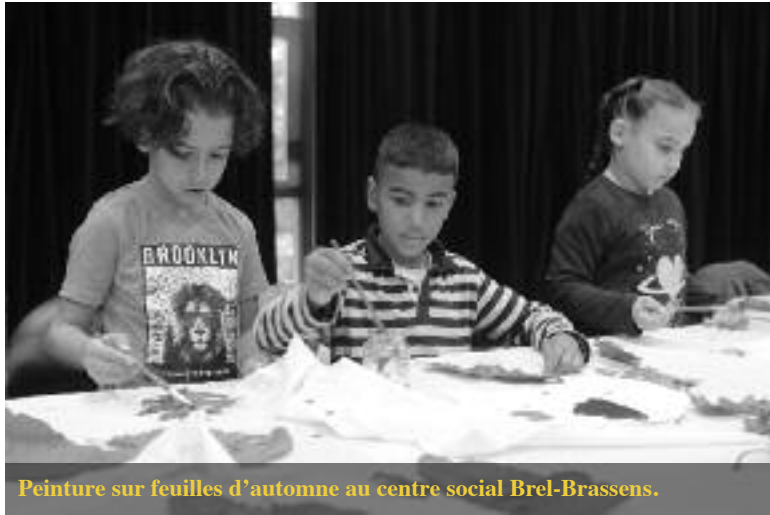
Peinture sur feuilles d'automne au centre social Brel-Brassens.