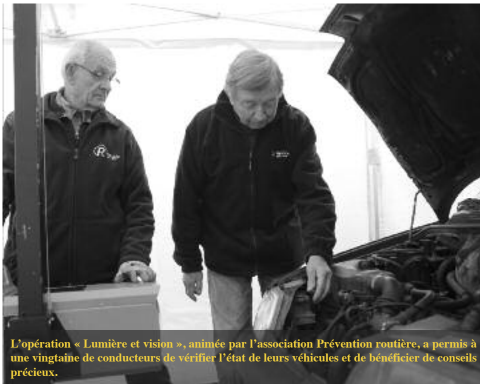
L'opération « Lumière et vision », animée par l'association Prévention routière, a permis à une vingtaine de conducteurs de vérifier l'état de leurs véhicules et de bénéficier de conseils précieux.