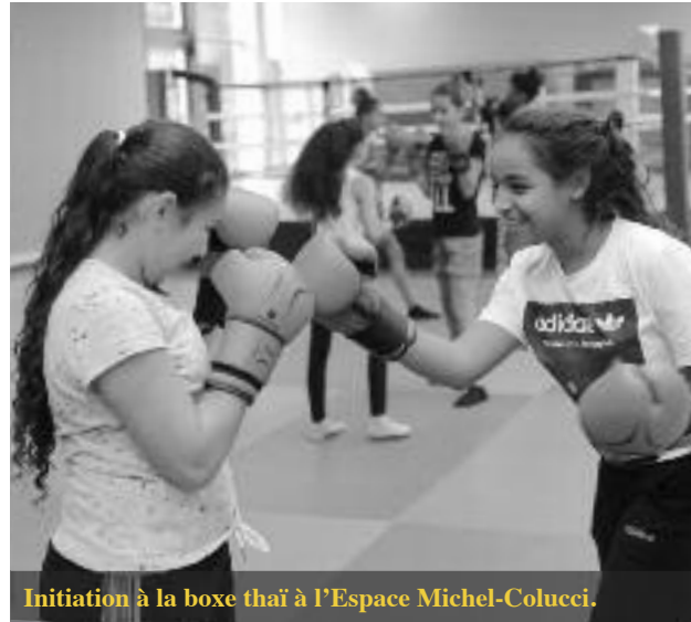
Initiation à la boxe thaï à l'Espace Michel-Colucci.