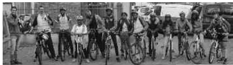
Le 20 septembre, les cyclistes de « Donnons des elles au vélo » ont accompagné les jeunes. Depuis la création d'Exploravélo, 30 enfants ont pu bénéficier du dispositif.

« Exploravélo est avant tout un projet éducatif et un levier de mobilité des jeunes, que ce soit pour leurs loisirs ou leur projet d'orientation. Des jeunes de tous les quartiers de la ville partent à la découverte de lieux proches mais méconnus. Cela permet de favoriser le vivre ensemble par les échanges interquartiers. Par dessus tout, ils gagnent en confiance et en motivation et s'ouvrent plus facilement aux autres. »