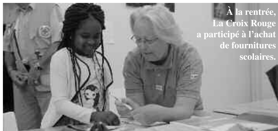
À la rentrée, La Croix Rouge a participé à l'achat de fournitures scolaires.