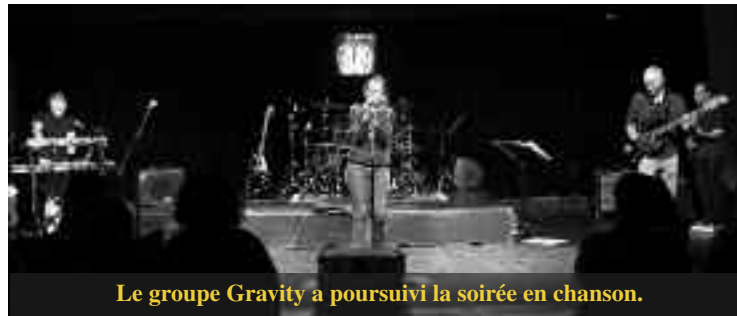
Le groupe Gravity a poursuivi la soirée en chanson.