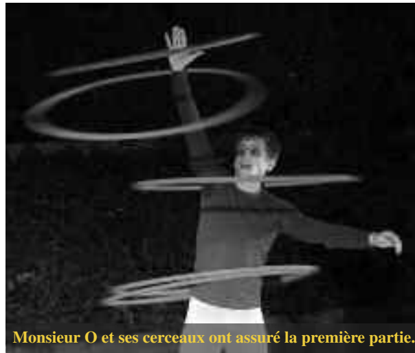
Monsieur O et ses cerceaux ont assuré la première partie.

Le premier opus de l'année pour la scène ouverte En voiture Simone s'est déroulé vendredi 29 septembre au centre culturel Simone-Signoret, avec, en première partie, une prestation offerte par le Théâtre de l'Agora.